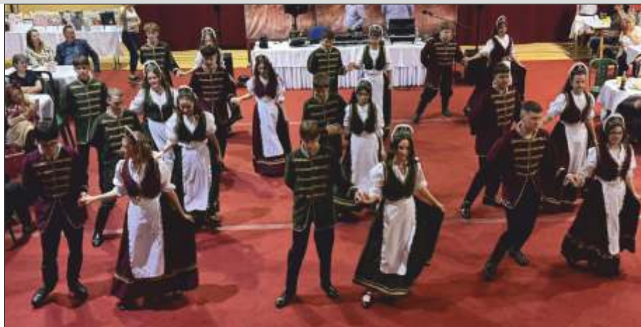
Gyermeki emlékek ünnepi keretben