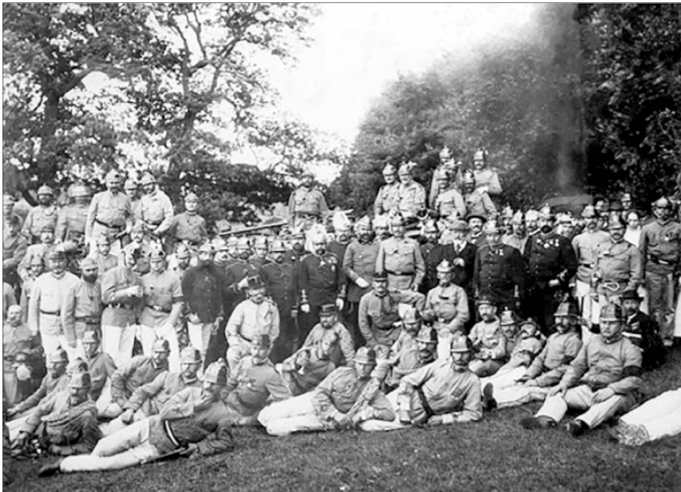
Zászlóavatási ünnepség csoportképe /1888/

A sorozat 8. részében már írtam az alcsúti önkéntes tűzoltó szakasz megalakulásáról, az alapszabályról. Időrendi sorrendben először az alább következő írást kellett volna közzétenni, de sajnos csak most találtam meg ezt a cikket, amely 1893. január 13-án, a Nemzet című újság reggeli kiadásában jelent meg. A szöveget, melyet József Károly főherceg írt – az újság szerint – az alcsúti levéltárból kapták meg közlésre. Ezt nem lehet ellenőrizni, de elolvasva úgy éreztem, mintha visszaugrottunk volna 150 évet. Részletesen ismerteti, hogy kik voltak akkor – mesteremberek és földművesek –, akik bátran jelentkeztek tűzoltónak, és azt is, hogy az előző számban ismertetett alapszabály milyen körülmények között született meg. Az akkori helyesírásnak megfelelően hagytam a szöveget, úgy gondolom érdemes elolvasni, s a már akkor is itt élő családoknak keresgélni a nevek között, hátha az egyik ős neve megjelenik.