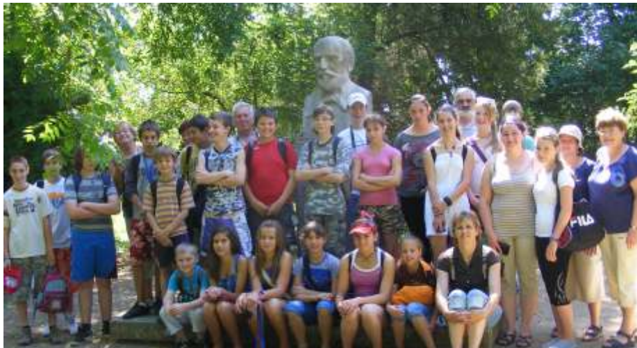
Az első helytörténeti vetélkedő résztvevői a jutalmul szervezett kiránduláson.